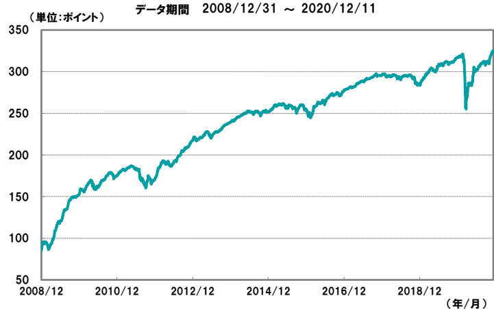
【図1】欧州ハイ・イールド債券指数の推移