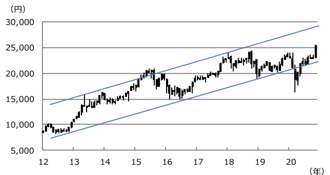
【図表2：日経平均株価の上昇トレンド】

(注) データは2012年1月から2020年11月。ローソク足は月足。ただし2020年11月は12日まで。上値抵抗線は2013年5月高値と2018年1月高値を結んだ線。下値支持線は2012年10月安値と2016年6月安値を結んだ線。 (出所) Bloomberg L.P.のデータを基に三井住友DSアセットマネジメント作成