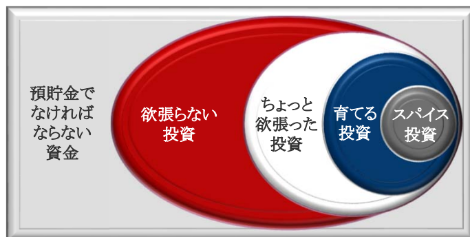
図表1:預金を含めた資産運用設計イメージ図

「スパイス投資」とは、当面使う予定がない本当の意味での余裕資金で、相応に高いリスクを取って高いリターンを目指す投資です。