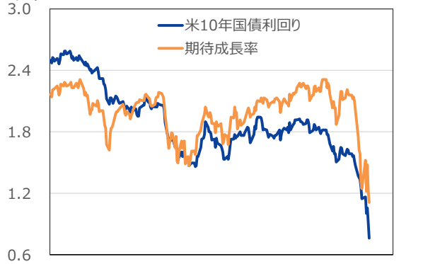
【米10年国債利回りと期待成長率】

(注1) データは2019年4月1日～2020年3月6日。 (注2) 期待実質成長率は割引配当モデルに基づき、以下の想定により試算。