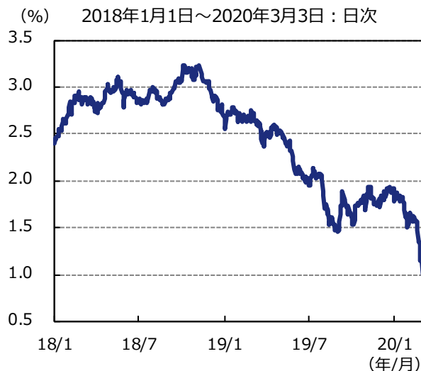
図表2 米国10年国債利回りの推移

期間：2008年1月1日～2020年3月3日（FF金利、日次） 2008年1月～2020年1月（コア個人消費支出（PCE）デフレーター/失業率、月次） （注）2008年12月16日以降、FF金利は誘導目標レンジの中央値を表記