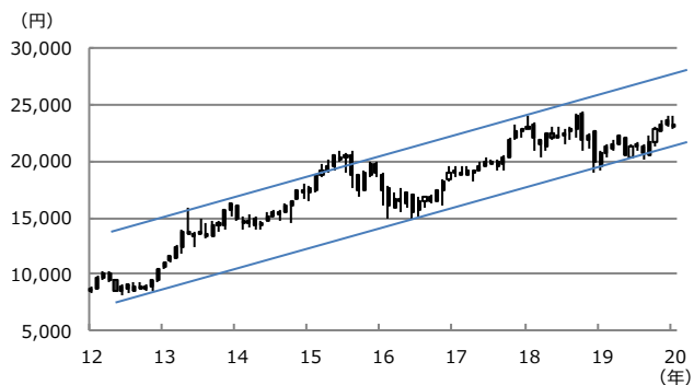
【図表1：日経平均株価の上昇トレンド】

(注) データは2012年1月から2020年1月。ローソク足は月足。上値抵抗線は2013年5月高値と2018年1月高値を結んだ線。下値支持線は2012年10月安値と2016年6月安値を結んだ線。