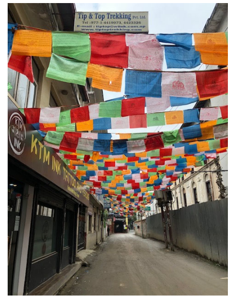
写真、左から。スワンプナート寺院に続く400段の階段、寺院のストゥーパ（仏塔）、タメル地区の路地裏にたなびくタルチョ（祈禱旗）。