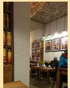
左写真：タメル地区の一画にあるチベット雑貨店など。写真右：タメル地区のカフェ。