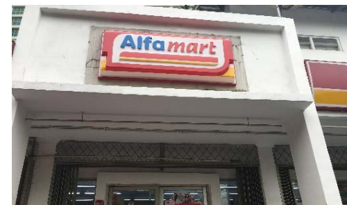
ジャカルタ市内のアルファマート。店内のATMでスマートフォンの電子マネーアプリにチャージ出来る等、市民の生活に密着している。国内に1万店舗以上を展開。