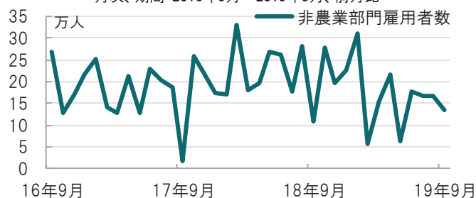
図表2：米労働参加率と新規雇用者数の推移