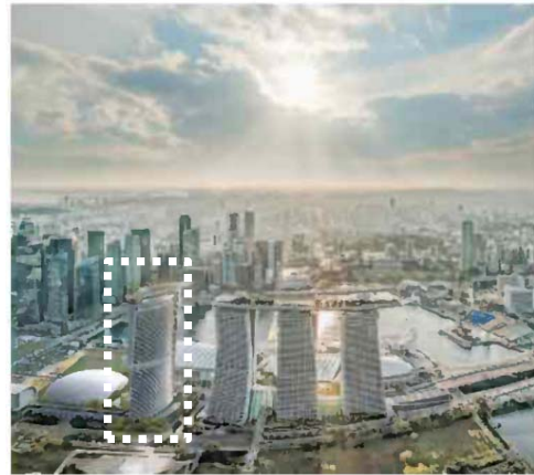
マリーナベイ・サンズの拡張完成予想図。4棟目の高層ビル（中央・左）を新設する

【シンガポール】シンガポール政府は、IRの拡充計画を発表した。既存のIRを運営する米ラスベガス・サンズとマレーシアのゲンティンが、カジノやホテルなどの新増設に合計90億シンガポールドル（約7400億円）を追加投資することを認めた。アジアではマカオやカンボジアなどでIRの開発競争が激化しており、シンガポールは拡張で対抗する。 2社はそれぞれ、45億シンガポールドルずつ投資する。IRの本格的な拡張は2010年の開業以来初めてとなる。政府は運営会社の新規参入を認めず、追加投資を条件に、2社に30年末までIR独占運営免許を与えるとした。 ラスベガス・サンズが運営する「マリーナベイ・サンズ」は既存ホテルに隣接する土地を取得し、4棟目の高層ビルを建設する。1千室の客室すべてをスイートとし、超高級ホテルにする。1万5千席のイベント会場もつくる。 観光地セントーサ島でゲンティンが運営する「リゾート・ワールド・セントーサ（RWS）」は2つのホテルを新たに設ける。このほか、テーマパークのユニバーサル・スタジオ・シンガポールの任天堂のゲームキャラクター、マリオが主役となる「スーパードンキーコングワールド」を新設する。 IRの重要な収入源であるカジノ部分の拡大も認める。面積ベースで3〜13%の拡大を認可し、カジノ・テーブルやマシンなど機器の数の上限も大幅に引き上げる。カジノ収入に課す税金の税率と入場税の引き上げにより、税収拡大にもつなげる。