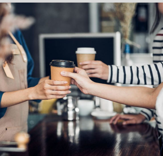
上記はイメージです。

2019年6月、世界的なコーヒーチェーン店のひとつであるスターバックスは、米国やカナダなどで先行導入していた新しいオーダーシステム「モバイルオーダー＆ペイ」を日本で開始しました。まずは東京都内の一部店舗から始め、2020年内に全国展開を目指しています。