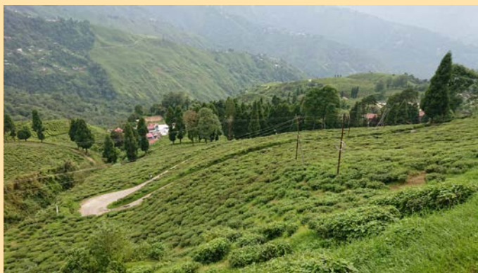
左写真：急峻な斜面に広がる茶畑。電線が茶畑を通っています。

ダーズリンティーは“紅茶のシャンパン”と言われ、ダーズリンと言えば紅茶というイメージですが、紅茶だけでなく、緑茶やウーロン茶なども生産されています。ちょっと意外ですが、ある地元の方（仏教徒）に聞くと、朝起きてすぐは緑茶、日中はウーロン茶を飲む、とのことでした。