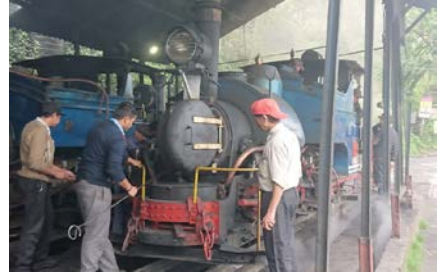
写真、左から。世界3位の高峰カンチュンジェンガ、ダーズリン市街を歩く僧侶、ダーズリン・ヒマラヤ鉄道の蒸気機関車。