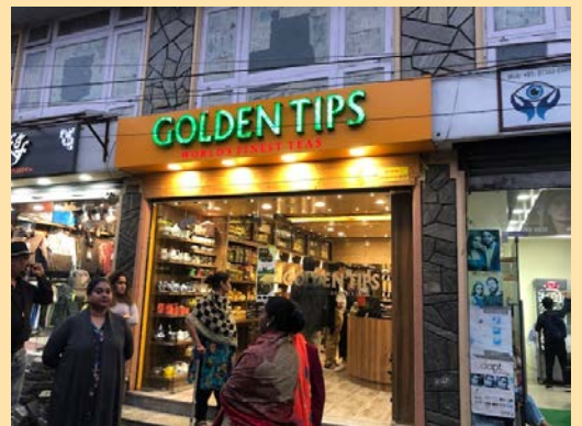
右写真：街中のいたるところに茶葉のお店。