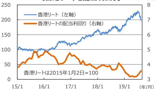
【香港リートと配当利回り】

(注) データは2015年1月2日～2019年8月14日。配当利回りは2015年1月～2019年8月。月末ベース。2019年8月は14日現在。