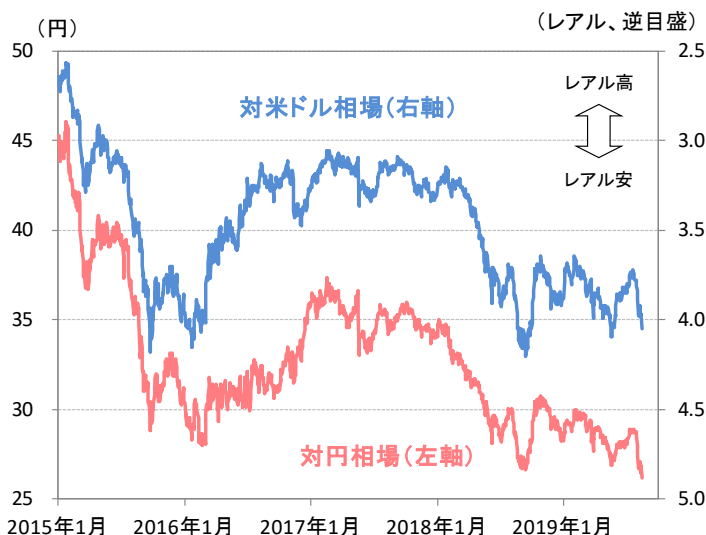
図1:ブラジル・レアル相場(対米ドル、対円)の推移

もっとも、今回の為替介入策は新規の米ドル売り介入ではなく、既存の通貨スワップ介入残高の一部を米ドル売却と引き換えに解消するものであることから、通貨防衛を目指した政策というよりも、為替市場(スポット・先物)の需給安定化を目指した政策としての意味合いがありそうです。