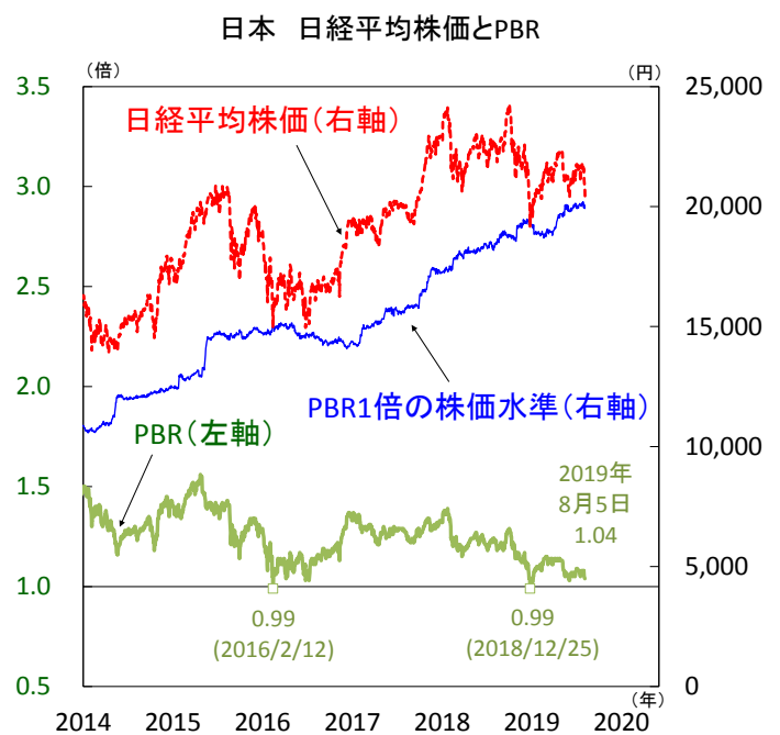
【図3】日本株の割安感が一段と強まる、PBRが1倍割れとなれば底堅い動きに