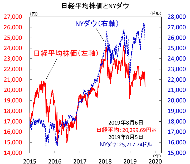
【図1】米国による対中国追加関税の賦課表明を受け、リスク回避の動き強まり株価が大幅下落

投資家心理を示すVIX指数が急上昇しており市場は今後も不安定な展開が見込まれます(図2)。米金融当局の積極的な利下げ姿勢が安定化の鍵となりえます。日本株はPBR1倍割れの可能性もあり、1倍割れの水準では割安感に着目した資金流入が期待されます(図3)。(向吉)