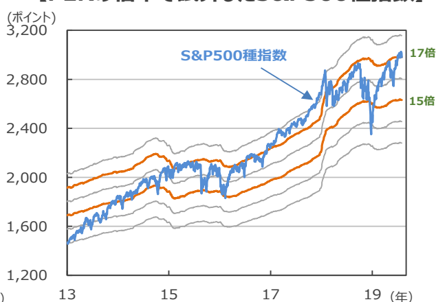
【PERの倍率で試算したS&P500種指数】

(注) データは2013年1月2日～2019年7月31日。株価収益率（PER）の倍率（13倍～18倍）に1株当たり予想利益をかけてS&P500種指数の水準を試算。1株当たり予想利益は12カ月先予想ベース（I/B/E/S予想）。 (出所) Bloomberg L.P.のデータを基に三井住友DSアセットマネジメント作成