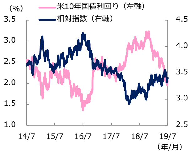
米金利と相対指数の推移

※期間：2014年7月8日～2019年7月8日（日次） 相対指数 = US-REIT*2 ÷ 米株価指数*1