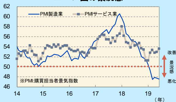
ユーロ圏の景況感