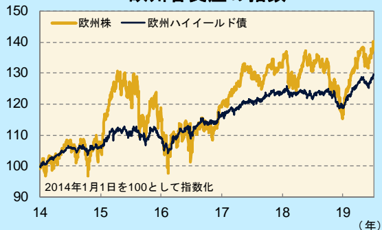
欧州各資産の指数