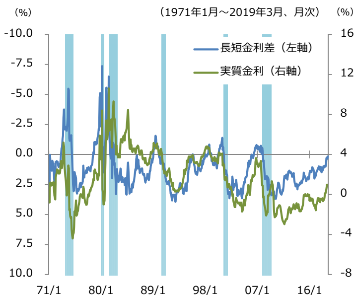
図表3 長短金利差、実質金利と景気後退期