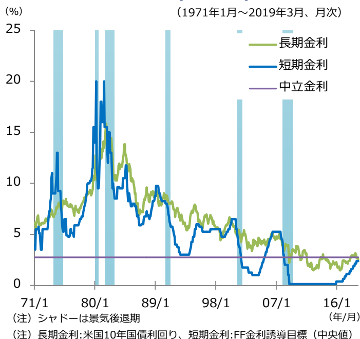
図表2 長短金利差と景気後退期