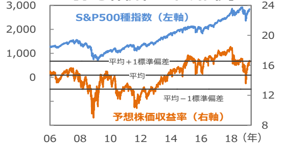
(ポイント) 【予想株価収益率の推移】

(注) データは2006年1月3日～2019年3月22日。予想株価収益率の平均、±1標準偏差の計算期間は2006年1月3日～2019年2月28日。予想株価収益率を算出する際の1株当たり予想利益は12カ月先予想（予想はBloomberg L.P.集計）。