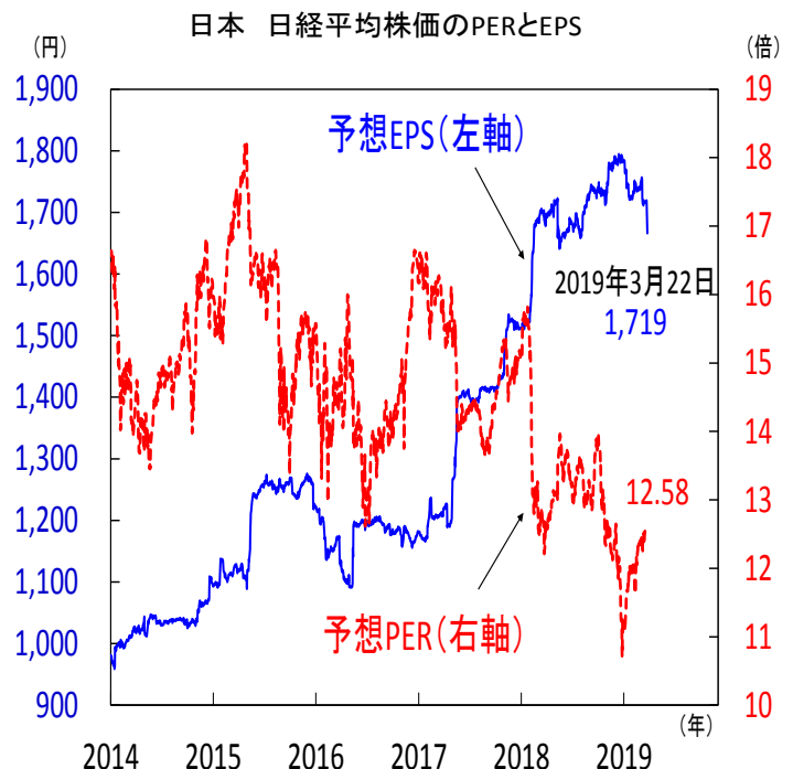
【図3】予想EPSは切り下げ傾向

注) 直近値は2019年3月22日。株価=EPS×PER。EPSは一株当たり利益、PERは株価収益率。