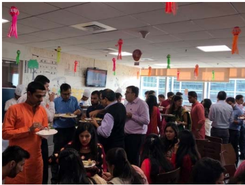
ディワリの前週はオフィスでもディワリランチを提供