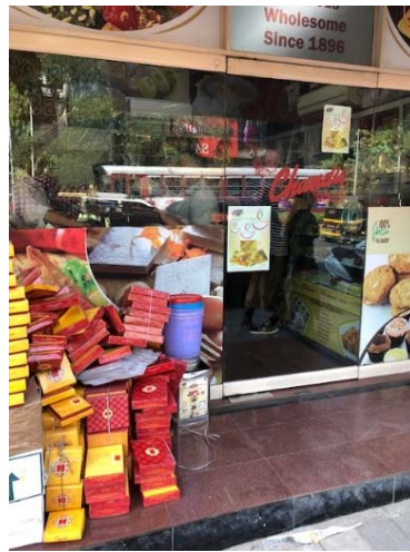
ギフト需要でお菓子屋さんは大忙し