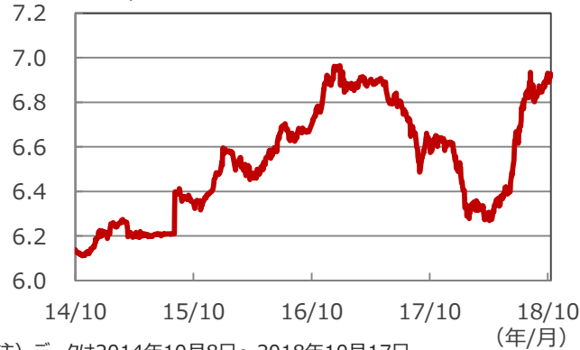
(人民元/ドル) 【人民元の動向】

(注) データは2014年10月8日～2018年10月17日。