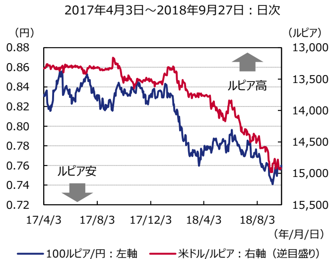
図表2 インドネシアルピアの推移

（注）インドネシア中央銀行は2016年8月19日に政策金利をBIレートからBI 7日物リバースレポ金利へ変更