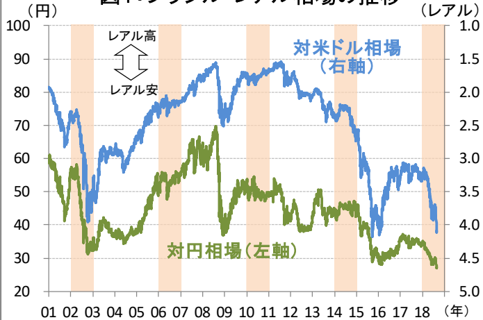
図1:ブラジル・レアル相場の推移

足元の不安定なレアル相場の背景には、市場が期待する財政・年金改革に前向きなアルキミン氏(PSDB)の支持率が伸び悩んでいることも一因とみられます。アルキミン氏は中道政党との連立によりテレビ・ラジオでの政見放送時間の44%を獲得しており、8月31日からの政見放送開始後に支持率上昇がみられるかに注目が集まります。