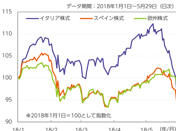
図表1：イタリア等株式市場動向