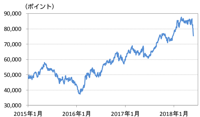
図1：ブラジル・ボベスパ指数（株価指数）の推移

ブラジル中銀のゴールドファイン総裁は5月28日、トラック運転手のストライキによるインフレへの影響は一時的に留まり、金融政策に影響する可能性は低いとの見方を示しました。今後は、ストライキが短期間で収束に向かうかどうかや、レアル相場の行方が金融政策の先行きを左右する注目材料となりそうです。