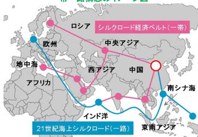
(中国国務院の情報をもとに日興アセットマネジメントが作成)

逆に言えば、約 14 億人を数える中国国民の一人当たり GDP が約 2.8 倍になるとすれば、世界に占める中国経済のシェアはとてつもなく大きいものとなる。それゆえ、実現不可能とささやかれても致し方ないが、中国の為政者としては、どのようにして実現させるかが、腕の見せ所となるはずだ。