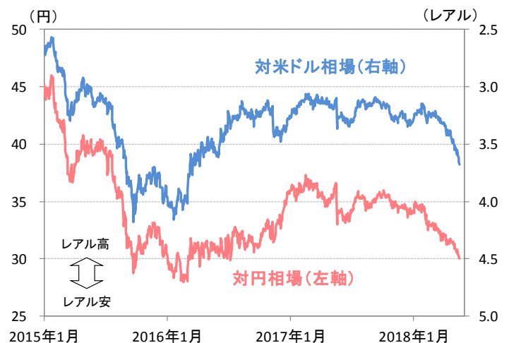
図2：ブラジル・レアルの対米ドル、対円相場

(期間) 政策金利：2016年1月1日～2018年5月16日 拡大消費者物価指数 (IPCA)：2016年1月～2018年4月 (注) ブラジル中銀のインフレ見通し (市場シナリオ) は、政策金利と為替レートの予想前提に市場コンセンサスを使用したもの。政策金利の市場コンセンサスは2019年6月末まで。