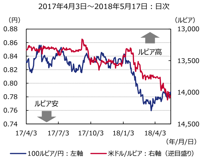
図表2 インドネシアルピアの推移

(注) インドネシア中央銀行は2016年8月19日に政策金利をBIレートからBI7日物リバースレポ金利へ変更