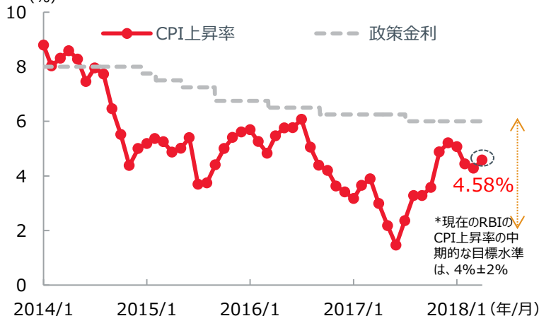
【インドの消費者物価指数（CPI）上昇率（前年同月比）の推移】 （2014年1月～2018年4月） （%）

（出所） Bloomberg L.P. のデータに基づきイーストスプリング・インベストメンツ作成。CPI上昇率は（2014年12月までは旧基準（2010年=100）、2015年1月以降は新基準（2012年=100））による統計。