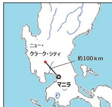
【ニュー・クラーク・シティ建設予定地】