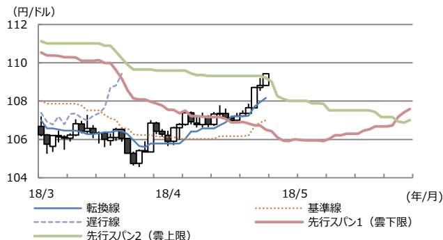
【図表2：ドル円の一目均衡表】

(注) データは2018年3月1日から4月25日。先行スパン1と先行スパン2は2018年3月1日から5月30日。 (出所) Bloomberg L.P.のデータを基に三井住友アセットマネジメント作成