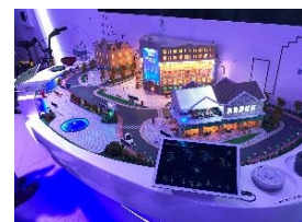
※MWC2018にて、パブリックセーフティの展示物

次に、世界中で導入されているパブリックセーフティの実例を紹介しましょう。米シカゴ市警察では、過去の犯罪記録や天候、経済動向などから犯罪の一定パターンを見出す犯罪予測システム「Hunchlab」を導入し、警備体制を見直したことなどにより、7ヵ月間で発砲事件が約4割、殺人事件が約3割減少したとのことです。また、2月に開催された平昌冬季五輪では、ドローンやロボット、5Gによる最新の警備システムが導入され、大きな事件や事故を起こすことなく無事に大会を成功に導きました。