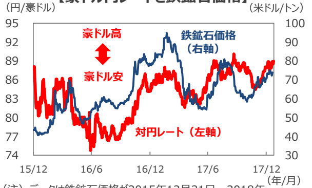
【豪ドル円レートと鉄鉱石価格】

(注) データは鉄鉱石価格が2015年12月31日～2018年1月19日。為替が2015年12月31日～2018年1月23日。