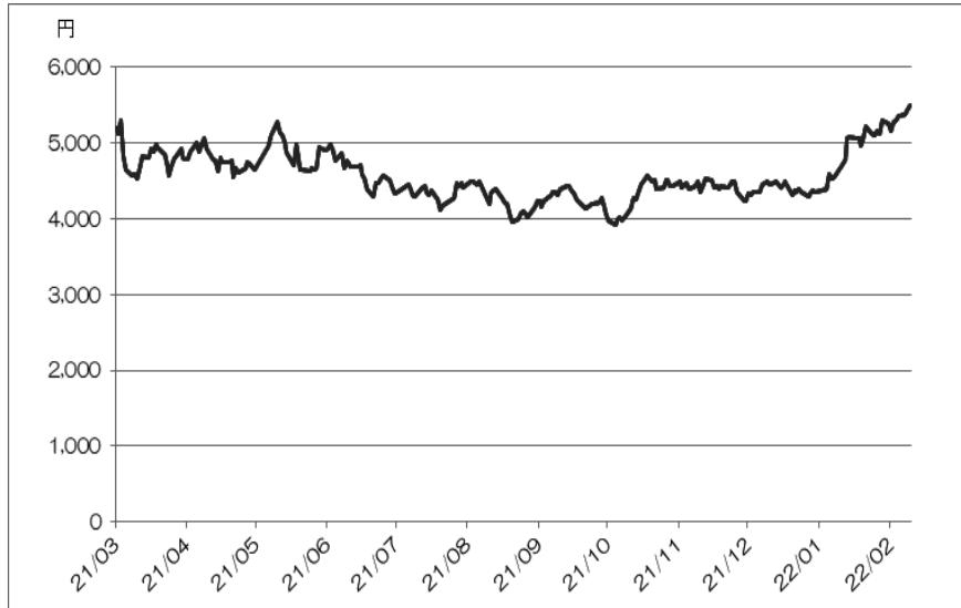
<住友金属鉱山株式会社の終値の推移>