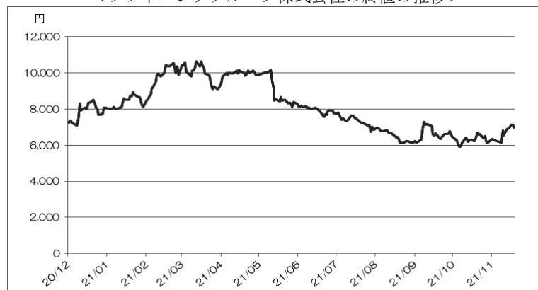
＜ソフトバンクグループ株式会社の終値の推移＞

(注) ただし、2021年11月は11月18日まで。2021年11月18日の東京証券取引所におけるソフトバンクグループ株式会社の株価終値は6,986.0円であった。