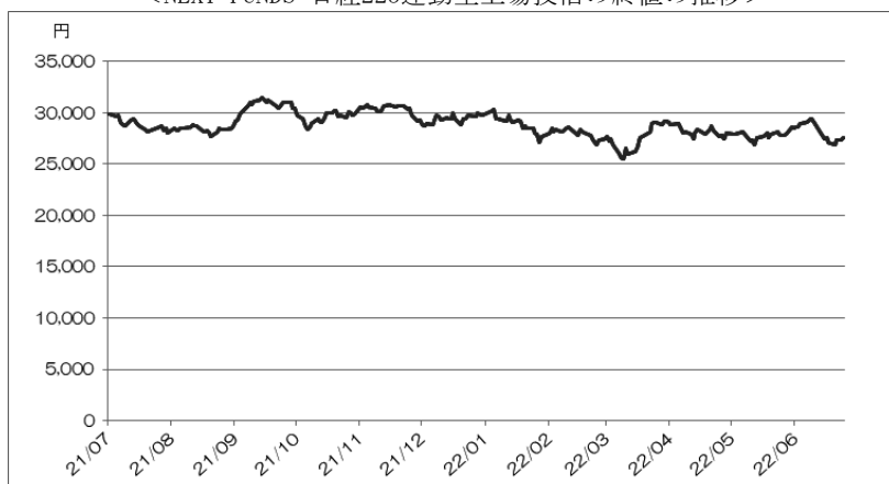
<NEXT FUNDS 日経225連動型上場投信の終値の推移>

(注) ただし、2022年6月は6月24日まで。2022年6月24日の東京証券取引所におけるNEXT FUNDS 日経225連動型上場投信の終値は27,605.0円であった。