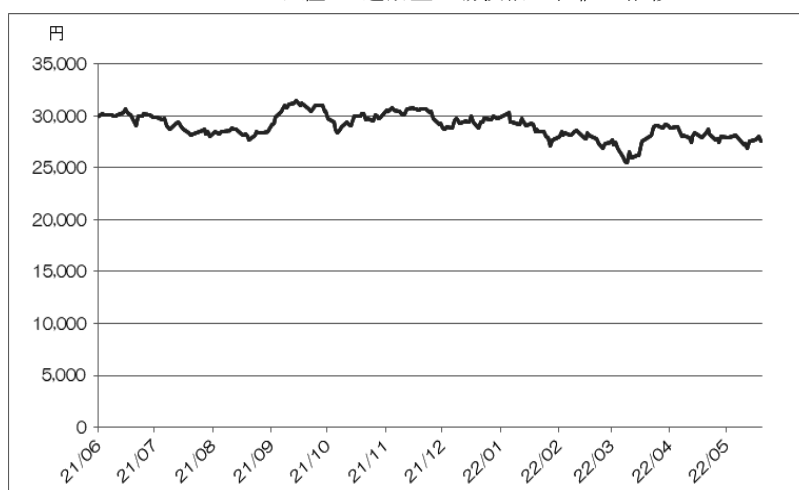
<NEXT FUNDS 日経225連動型上場投信の終値の推移>

(注) ただし、2022年5月は5月19日まで。2022年5月19日の東京証券取引所におけるNEXT FUNDS 日経225連動型上場投信の終値は27,510.0円であった。