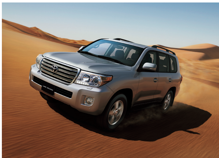
注) 上記写真の車両は海外仕様であり、日本で販売するものとは異なります。