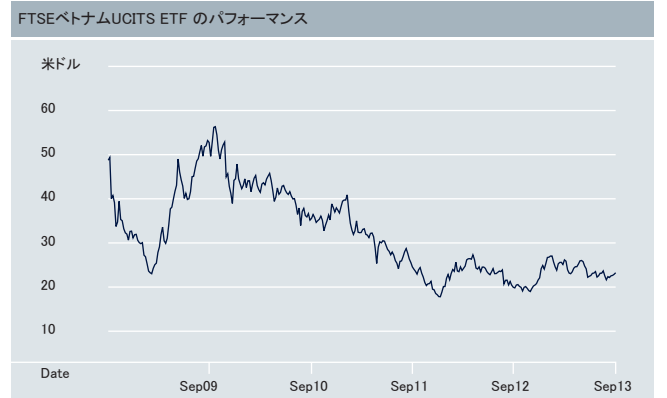
出所: ドイツ銀行、2013年9月30日 ETFのパフォーマンスは再投資された配当を含めて計算されています。インデックスのパフォーマンスはトータルリターンベースで算出されています。