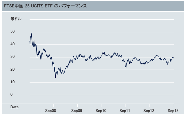
出所: ドイツ銀行、2013年9月30日 ETFのパフォーマンスは再投資された配当を含めて計算されています。インデックスのパフォーマンスはトータルリターンベースで算出されています。

出所: ドイツ銀行、2013年9月30日 2011年7月4日、連動対象のインデックスが TXINOU から GPDEU3TR (Bloombergティッカー) に変更されました。