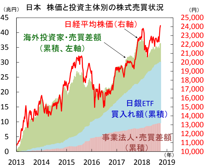
【図2】 海外投資家の売買動向が日本株に大きく影響

注) 直近値は2018年9月第4週、日経平均株価は2018年10月5日。 累積値(海外投資家は先物取引含む)は2013年1月第1週からの累積。 売買差額は株式市場での「買い」-「売り」。日経平均株価は週末値。