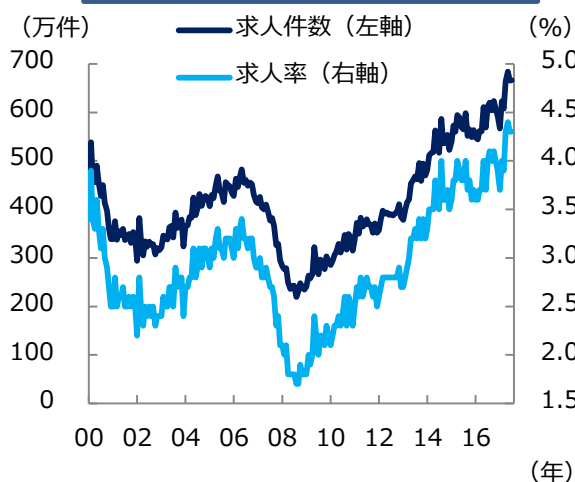
米 求人数と求人率の推移

こうしたことなどを考慮すれば、FRBは今後も緩やかなペースで利上げを継続するものと思われる。