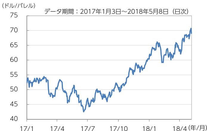
図表1：原油（WTI先物）価格推移