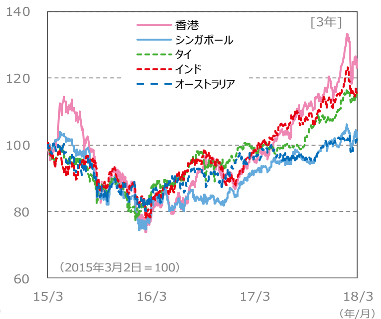
【国・地域別の株価指数の推移】