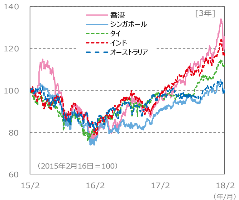
【国・地域別の株価指数の推移】 [3年]