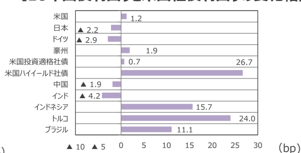
【10年国債利回りと米国社債利回りの変化幅】