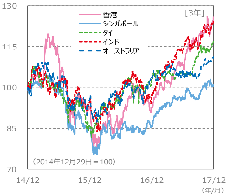
(ポイント) 【国・地域別の株価指数の推移】 [3年]