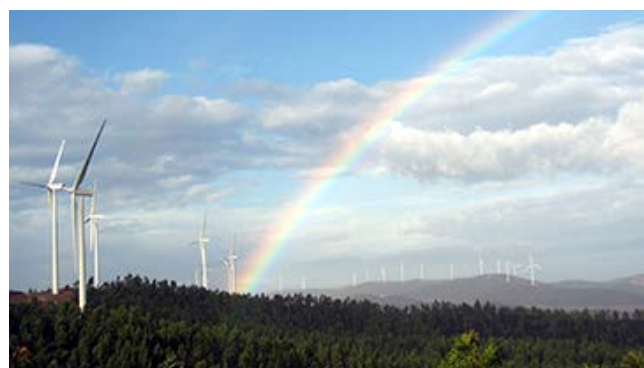
(スペイン南西部ウエルバ エル・アンデバロ風力発電所)

クリーン・エネルギーの推進に力を入れており、再生可能エネルギー源からの発電やスマート・グリッド(次世代送電網システム)の活用、効率的な電力貯蔵の普及等に積極的に取り組んでいます。