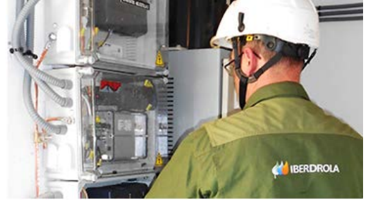
写真：メーター確認作業の様子

スマート・メーターには、従来の設備に最新の監視技術や情報通信技術を組み合わせた次世代の送電網システムであるスマート・グリッドが採用されています。それにより顧客に幅広いサービスの提供を可能にし、供給する電力の品質向上と将来必要とされる電力需要への対応等、最適な配電管理を実現します。