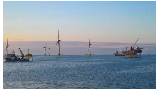
写真：建設中のウィキンジャー洋上風力発電所

風力タービン1基あたり約5メガワットの発電能力があります。70基全てが稼働すると合計約350メガワットとなり、ドイツの35万世帯以上に電力を供給することが出来ます。また、年間60万トン相当の二酸化炭素削減効果が見込まれます。